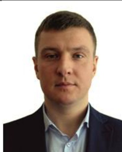
Акперов Вадим Вагіфович Заступник Голови Сумської обласної державної адміністрації Рік випуску: 2011 Спеціальність: Менеджмент ЗЕД