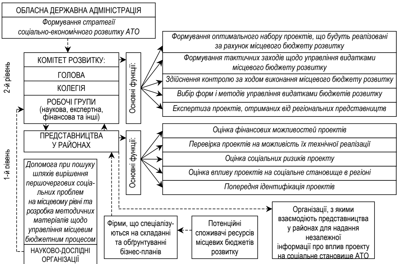
Рис. 2. Дворівнева система управління видатками місцевого бюджету розвитку

Особливе місце в системі інвестиційного забезпечення соціальної сфери займає організаційна складова, в першу чергу – в контексті побудови організаційного механізму управління видатками місцевих бюджетів розвитку. У сучасних умовах розвитку бюджетного процесу в Україні кардинально змінити існуючу систему органів управління видатками місцевих бюджетів розвитку, на нашу думку, складно, оскільки це потребує значних фінансових ресурсів, є довготривалим процесом, вимагає попереднього проведення адміністративно-територіальної реформи з надання більшої самостійності АТО тощо. Виходячи з цього, першим кроком на шляху реформування системи управління видатками місцевих бюджетів розвитку, який може бути реалізований вже сьогодні, запропоновано вважати створення єдиної інфраструктурної складової, основу якої складатиме колегіальний орган управління – Комітет розвитку при обласних органах виконавчої влади та його представництва при органах районної виконавчої влади (рис. 2). Основний склад Комітету розвитку повинен бути сформований за рахунок декількох робочих груп (у роботі пропонується формувати наукову, організаційну, фінансову, експертну та інші робочі групи; визначено їх функції та особливості роботи), а прийняття найбільш важливих рішень здійснюється колегією (її функції також конкретизовано в роботі).