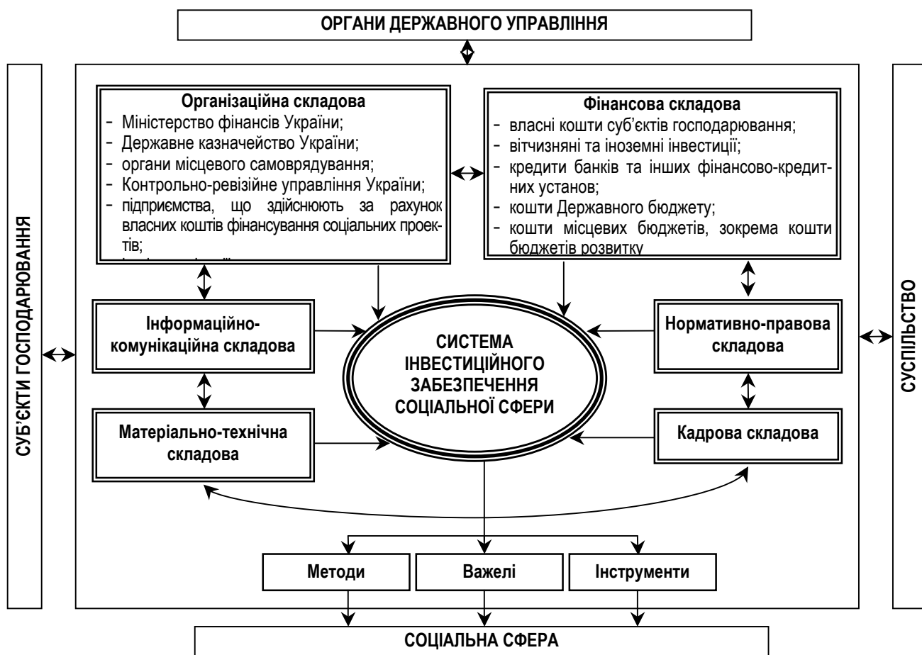
Рис. 1. Система інвестиційного забезпечення соціальної сфери

З метою ефективного інвестиційного забезпечення соціальної сфери автором запропоновано здійснювати управління видатками місцевих бюджетів розвитку на основі системи принципів, до складу якої запропоновано включити принципи: програмно-цільового використання бюджетних коштів; максимізації корисності, збалансованості, структурованості, цілісності, комплексності, відкритості, керованості, пріоритетності, безперервності, відповідності функціональних повноважень, своєчасності, гуманізму.